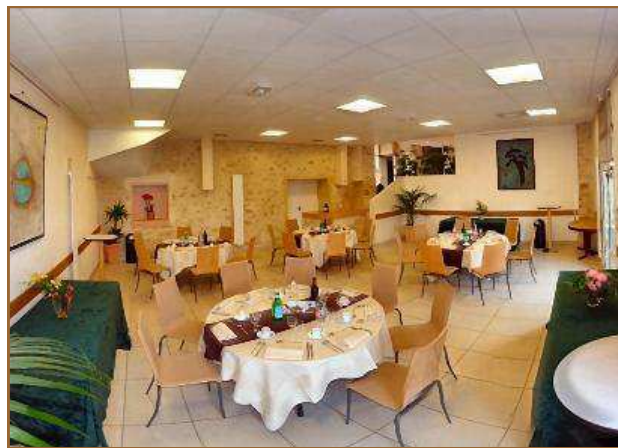
Déjeuner pour 35 personnes