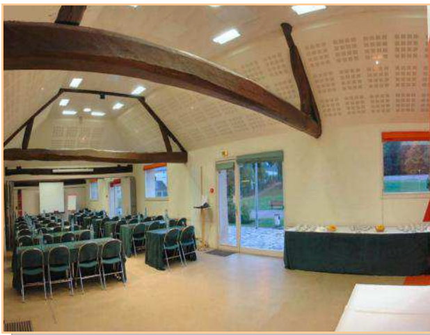
Réunion pour 60 personnes