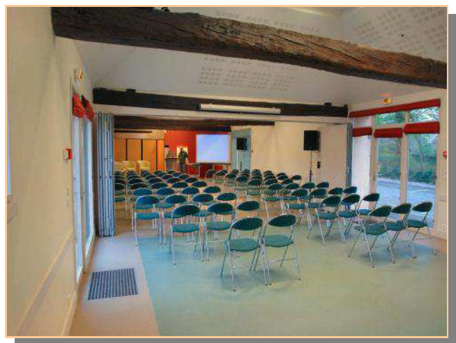
Réunion pour 80 personnes